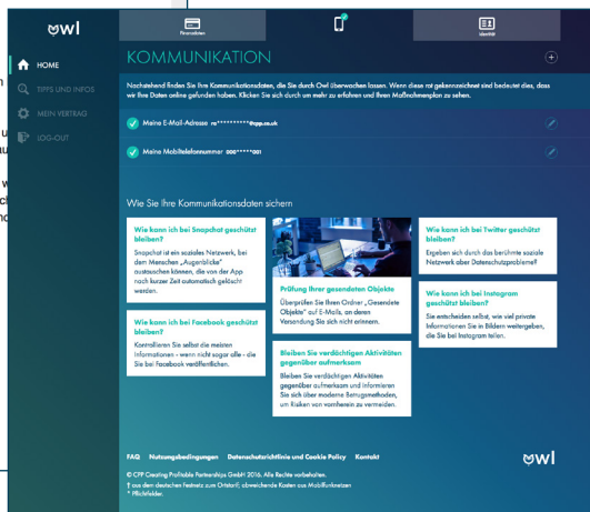
Abb 2: Übersicht hinterlegter Kommunikationsdaten