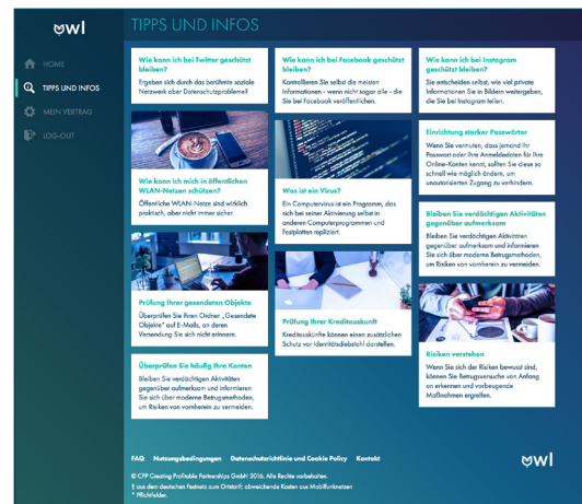
Abb 3: Tipps und Infos zur Sicherheit im Netz